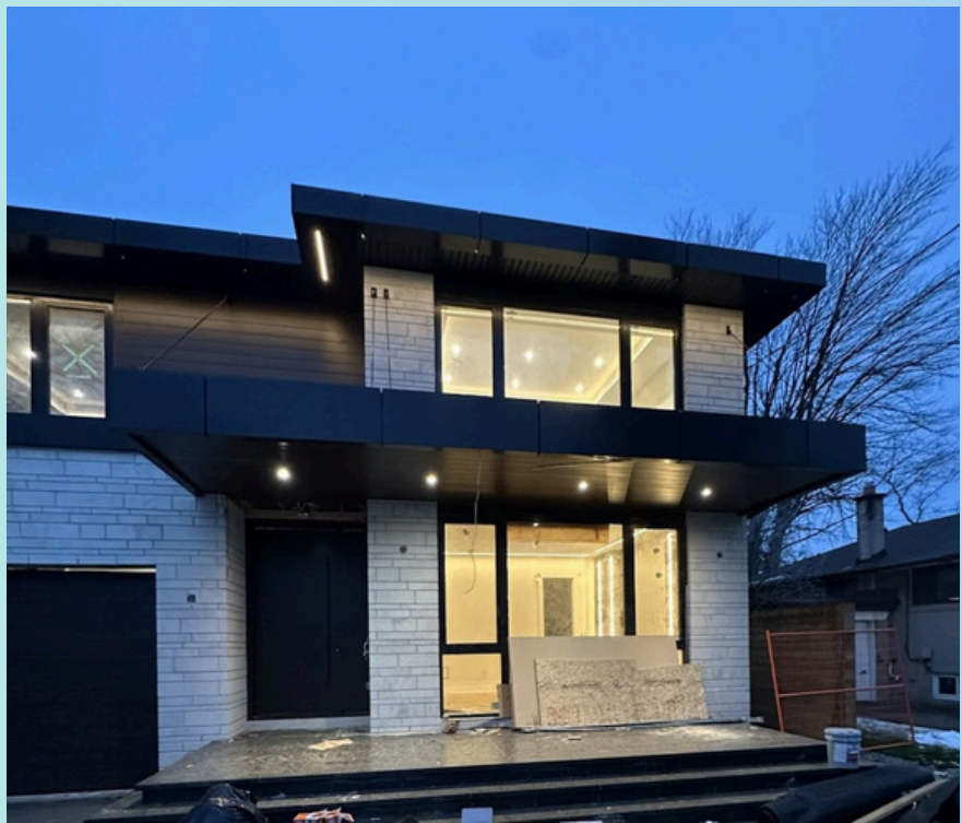
Résidence urbaine moderne

ACM Surface =1200 sq/ft WPC Surface =1500 sq/ft