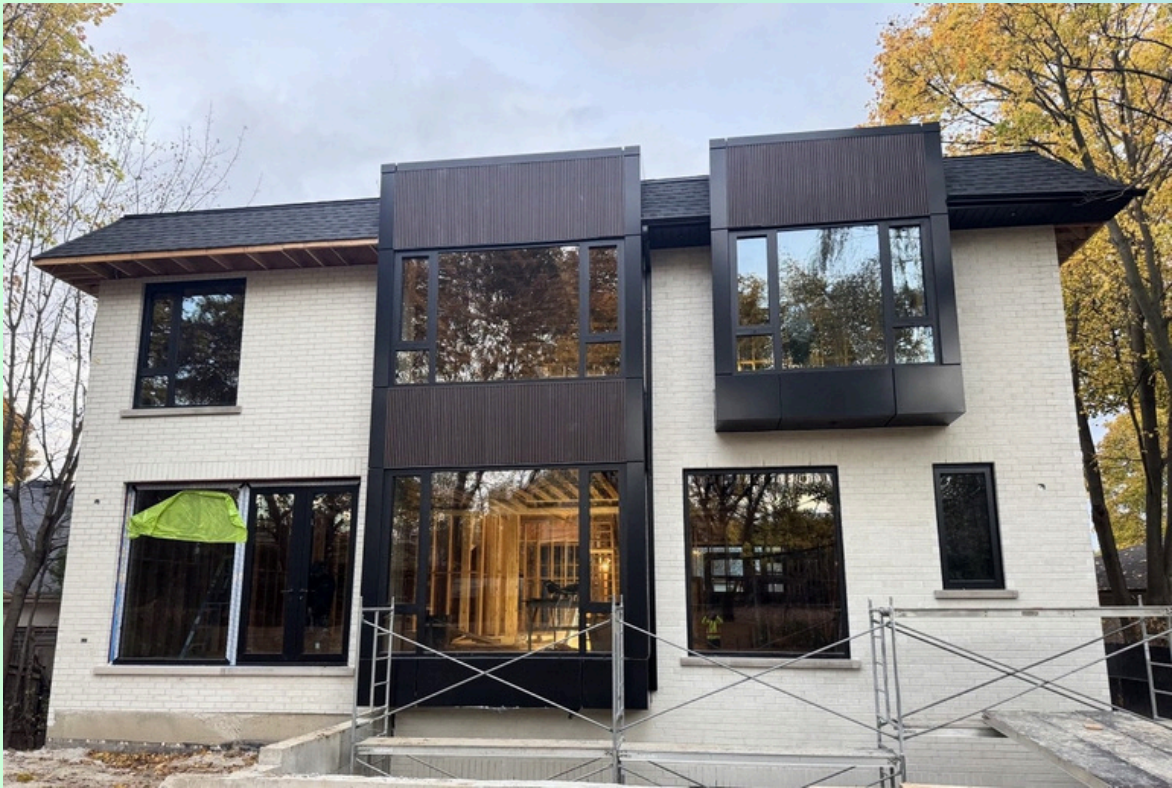
Résidence urbaine moderne

ACM Surface =1000 sq/ft WPC Surface =400 sq/ft