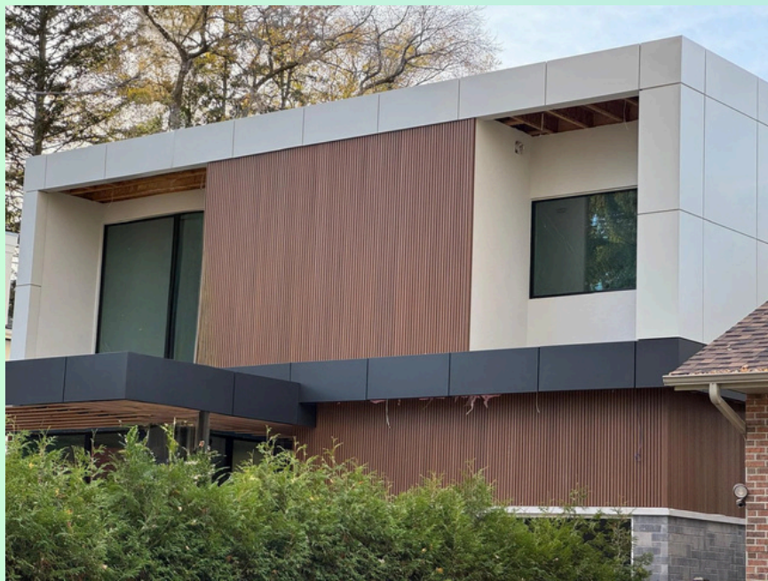
Résidence urbaine moderne

ACM Surface =1200 sq/ft WPC Surface =1500 sq/ft