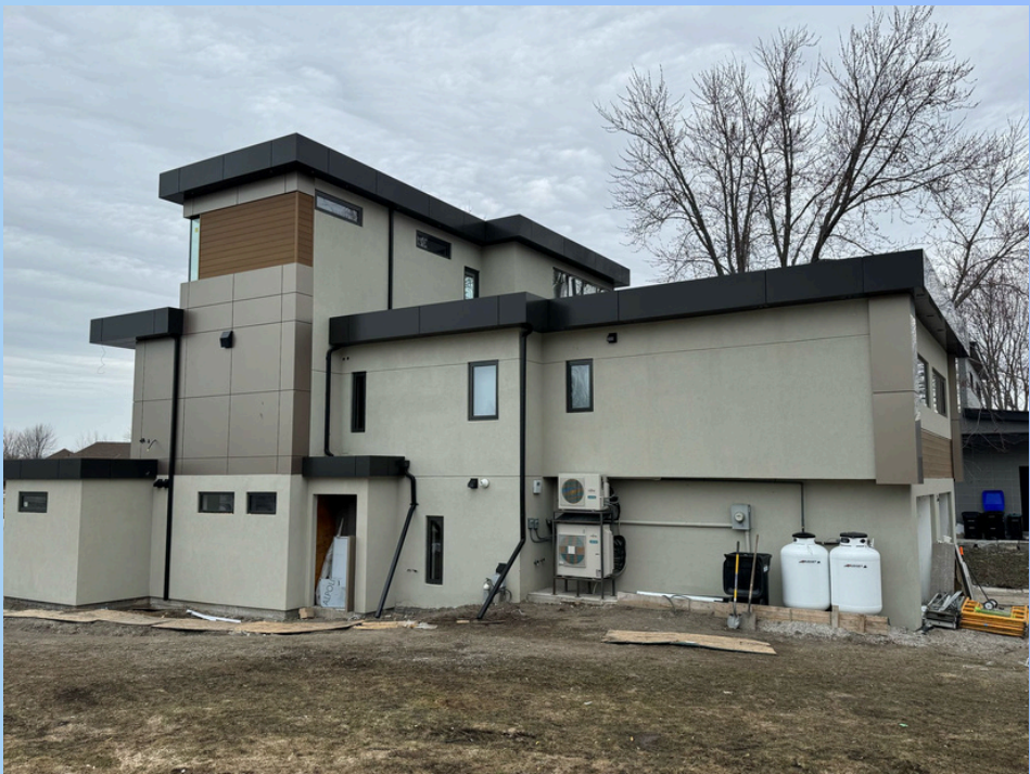
Résidence urbaine moderne

ACM Surface =1100 sq/ft WPC Surface =300 sq/ft