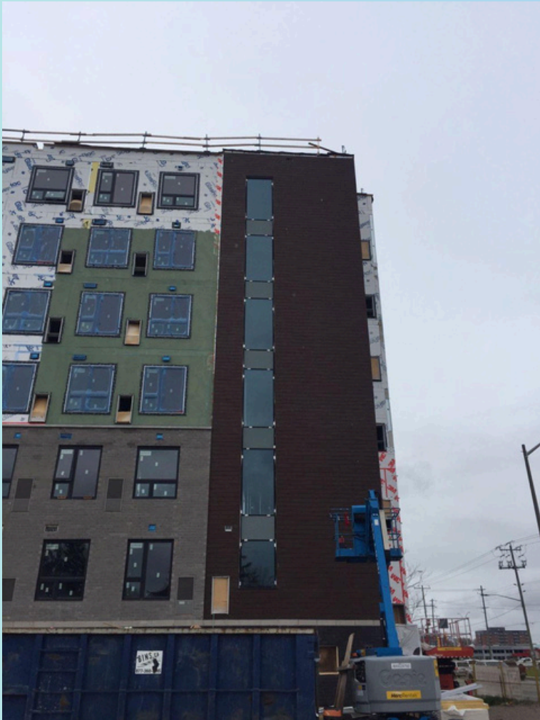
Résidence urbaine moderne

ACM Surface =1000 sq/ft WPC Surface =400 sq/ft