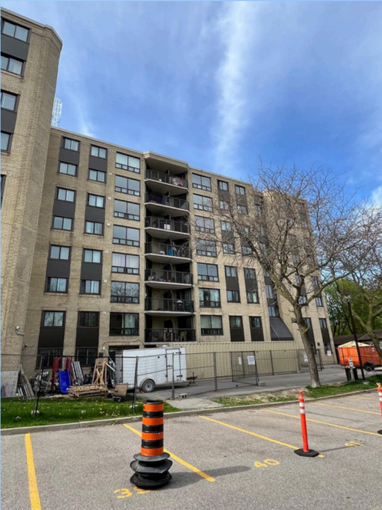
Résidence urbaine moderne